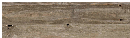
WoW! Solid Old grau WoW! Solid Old grey