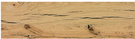
WoW! Eiche Crack WoW! Oak Crack