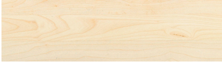
WoW! Ahorn WoW! Sycamore