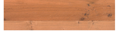
WoW! Eiche Broncé sprinkled WoW! Oak Broncé sprinkled