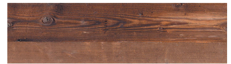
WoW! Solid Old braun WoW! Solid Old brown