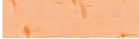
WoW! Fichte Broncé WoW! Spruce Broncé