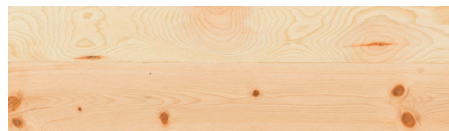
WoW! Zirbe WoW! Swiss Pine